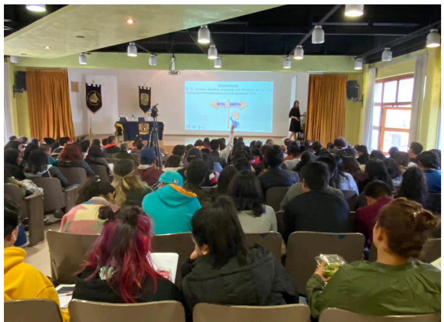
La Cátedra constará de 15 sesiones.

Al finalizar la presentación, explicó que “debe ser laica, pues busca llegar a acuerdos [...]; refiere a la vida, y no sólo a la vida humana, sino también a la de animales y plantas, e incluso a la de entes inanimados como piedras o mares” , y cuenta con “un principio limitativo de acciones [...], donde el mínimo es no dañar la vida” . 🌱