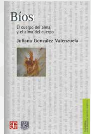
■ Juliana González 360 páginas

Al participar en la Cátedra, el PUB busca que los asistentes conozcan, comprendan, reflexionen y analicen los fundamentos éticos subyacentes en los dilemas de la Bioética, en un espacio transversal donde participen expertos en distintas áreas del conocimiento en ciencias biológicas y humanidades. 🌿