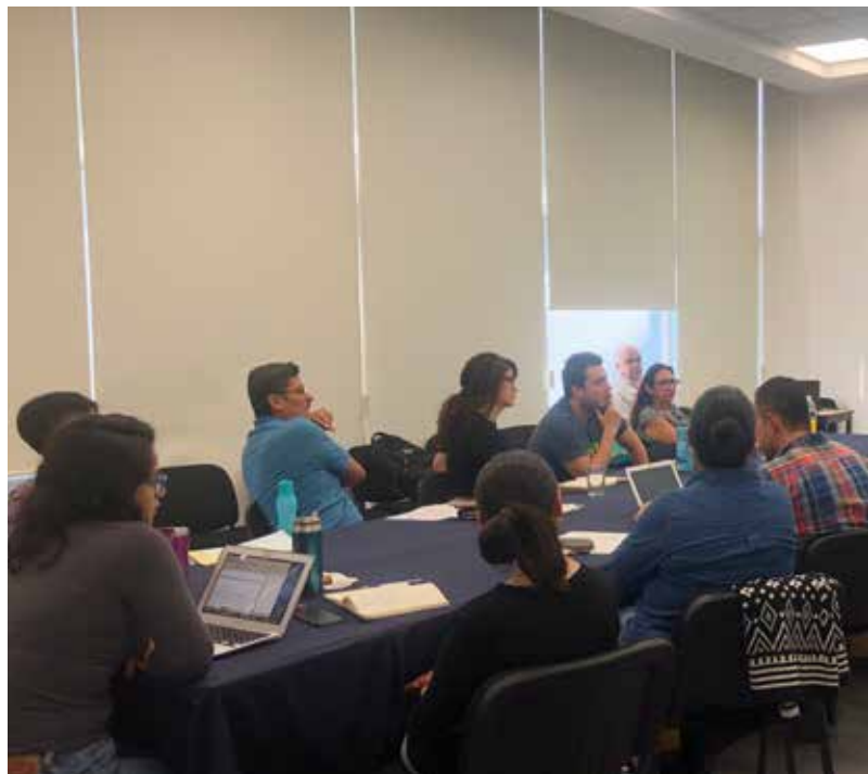
Los contenidos de los cursos impartidos resultan relevantes.

Para llevar la reflexión bioética a la vida, se realizó el curso en línea con opción a diplomado “Dilemas al inicio y fin de la vida” , mediante el cual se analizaron y reflexionaron los dilemas de la vida y su propia interrupción con el fin de desarrollar un pensamiento crítico del uso de estas tecnologías.