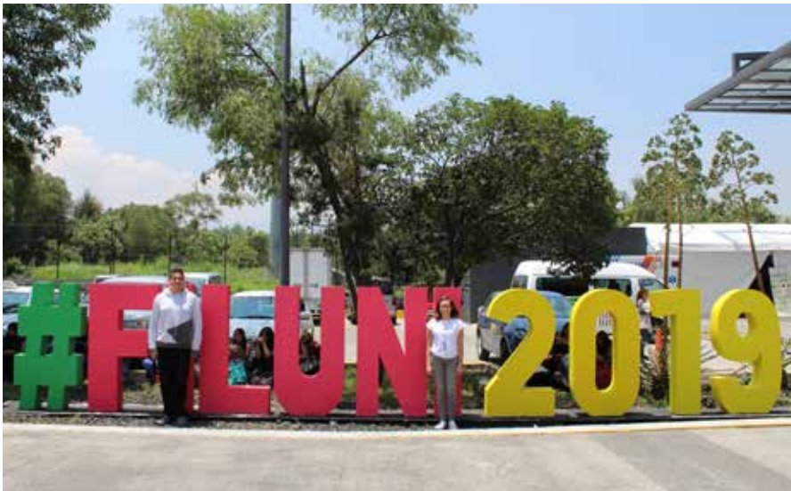
Algunos miembros del PUB estuvieron presentes en la Feria Internacional del Libro Universitario 2019,