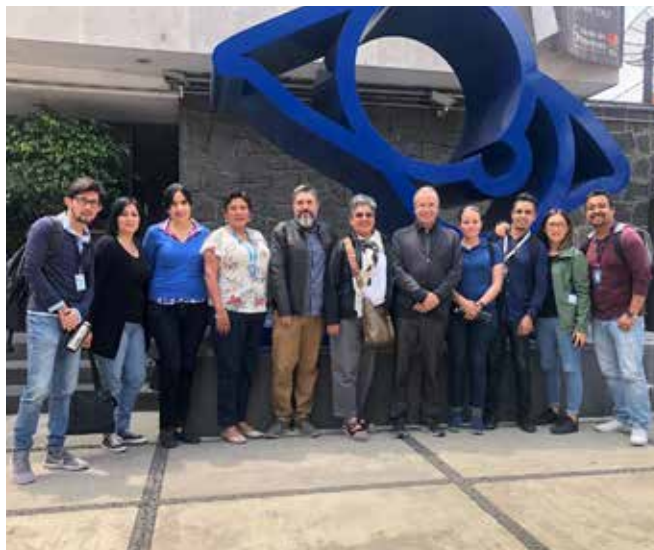
El PUB colaboró con la Asociación para Prevenir la Ceguera en México.