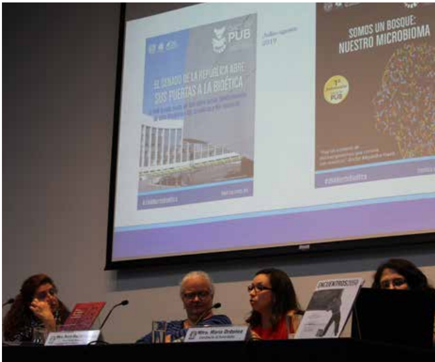
La Gaceta PUB da a conocer la labor académica del Programa.