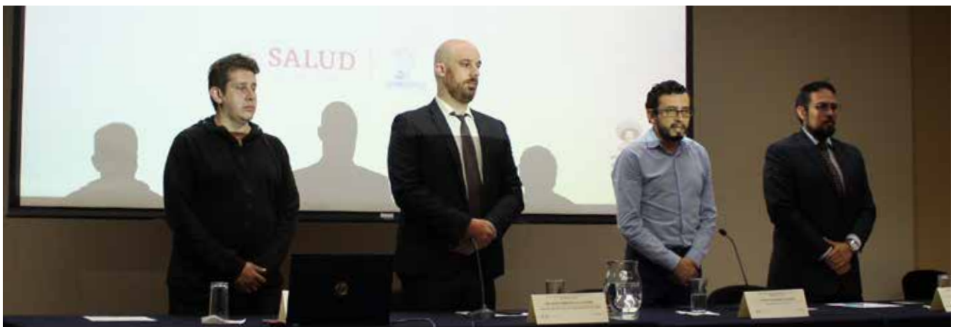
El curso-taller fue impartido por docentes de las comisiones Nacional de Bioética y de Bioética de la CdMx, del PUB, el IPN, la UNAM y la UACM.

La actividad abordó el marco legal de la Bioética, los tipos de comités y sus funciones, los pensamientos éticos, los cuidados paliativos, la voluntad anticipada, la violencia de género y los dilemas bioéticos en el segundo y tercer nivel de atención. 🌿