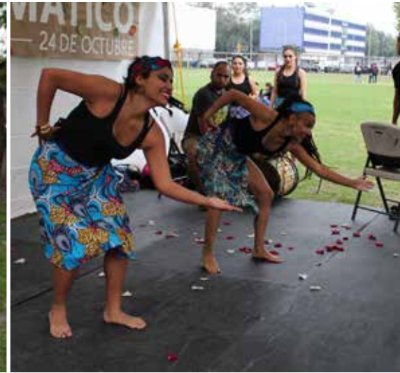
Conferencia, regalos ecológicos, música, teatro y danza.