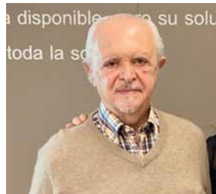
Doctor Mario Molina.

El Árbol de las ideas. Bioética: ciencia y filosofía para la vida sale al aire los miércoles a las 16 horas por el 96.1 de FM, con su retransmisión el sábado a las 19 horas por el 860 de AM. Finalmente, los podcasts de los programas están disponibles en el sitio web de Radio UNAM y en conjunto constituyen una excelente introducción al mundo de la Bioética.