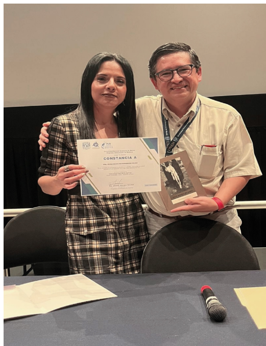
El Centro Cultural Universitario fue sede del cine-debate de septiembre.